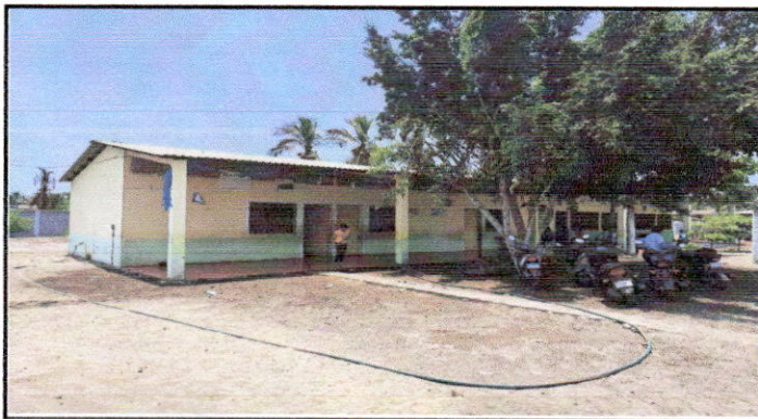
Foto 3: pintura interior y exterior de las aulas y sustitucion de balcones